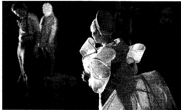
De man zonder eigenschappen

Hooggespannen verwachtingen werden niet ingelost bij deze sobere, saaie encenering. Personages zonder vaste overtuiging of doel praten in pakweg een uurtje of vier heel wat af, maar uiteindelijk luister je niet meer; slechts een paar acteurs konden echt uit de voeten met hun zware tekstmateriaal.