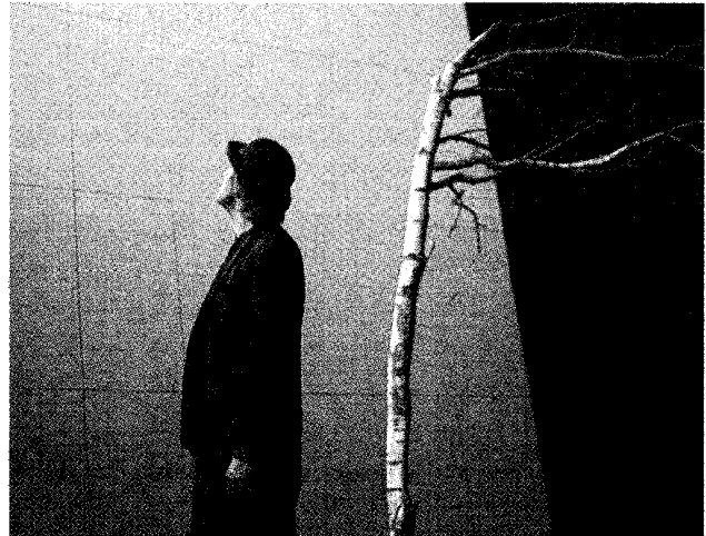
Wachten op Godot